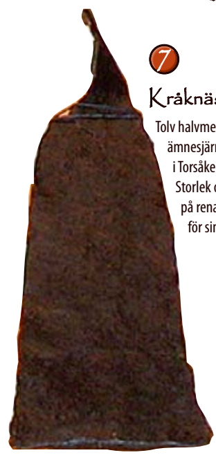
7 Kråknäsjärmet. Tolv halvmeterlånga ämnesjärn hittades i Torsåker. Storlek och antal tyder på rena järnverket för sin tid.