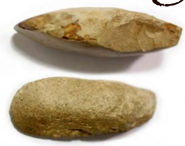
10 Yxor från Vittersjö Yxor tillverkade av stensmeder för mer än 7000 år sedan.