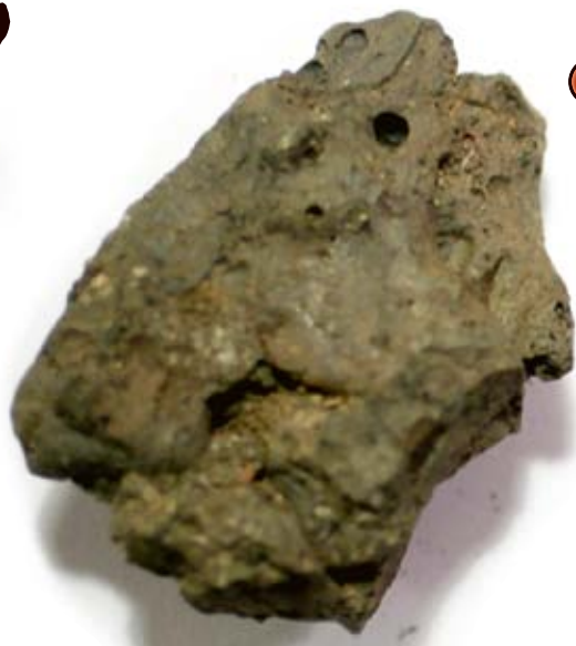
6 Slagg från Valbo köpstad. Slaggen avslöjar en omfattande järnproduktion på en plats vi i dag mest förknippar med elektronik och möbler.