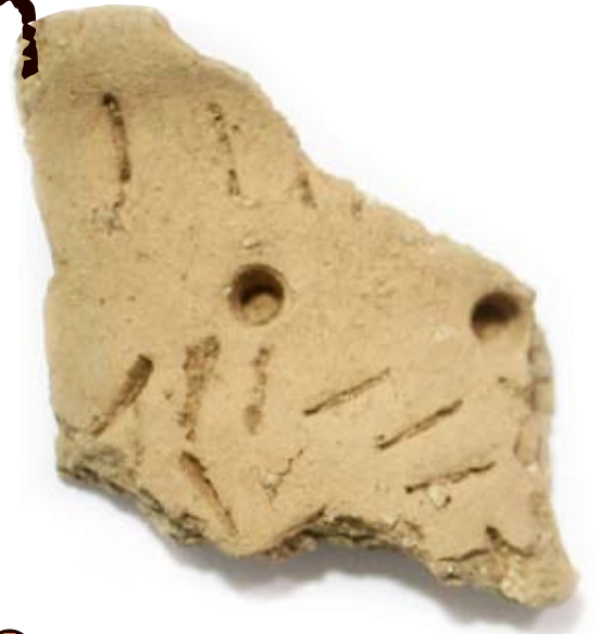
9 Keramik, Södra Märtsbo Gropkeramik med sitt tidstypiska mönster som någon lagt en del möda på för att få en vacker dekoration.

En sten, en benflisa eller ett stycke slagg kan avslöja hur våra äldsta förfäder levde