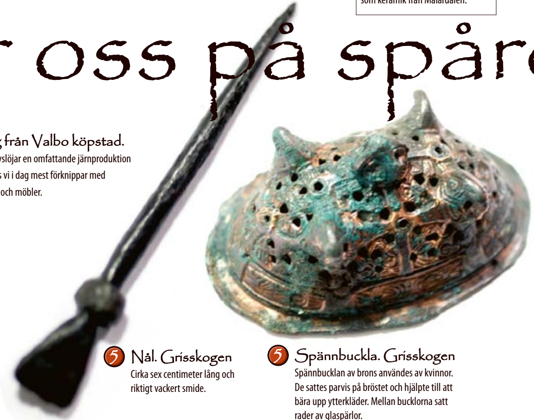
5 Nål, Grisskogen Cirka sex centimeter lång och riktigt vackert smide.