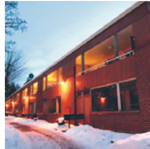
Första bostaden: Björkrisvägen 2 C, Brickebacken, Örebro