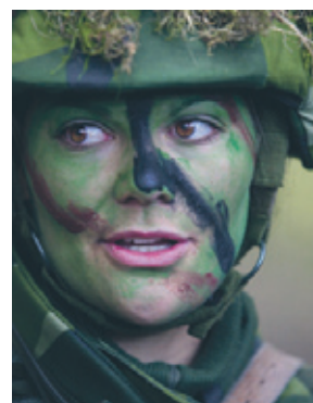
Victoria gör grundläggande militärutbildning hos SWEDINT.