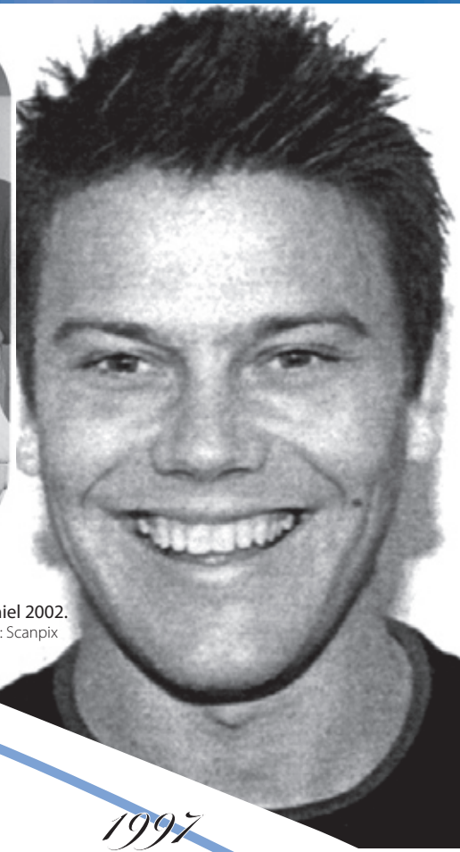
Daniel 2002.