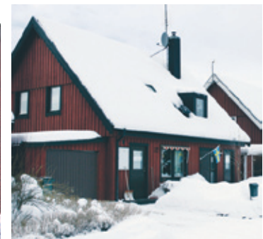
Andra bostaden: Smältvägen 12 i Ockelbo.