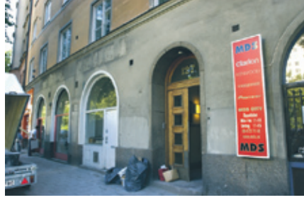
Daniels bostad på Birger Jarlgatan 127. En mardröm för SÄPO.