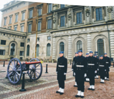
Första bostaden: Stockholms slott.