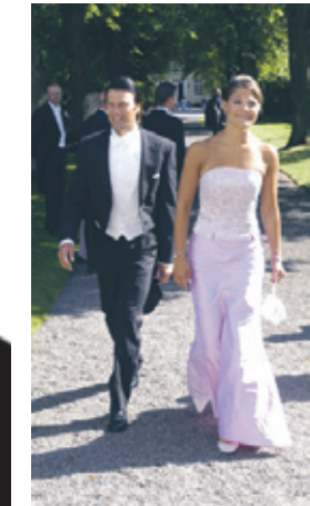
Tillsammans. Victoria och Daniel visar 2003 upp sig på ett bröllop i Linköping.