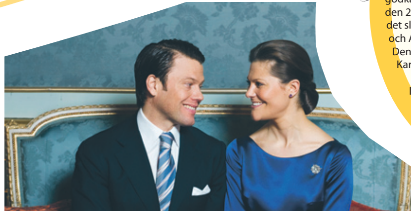
Daniel Westling och kronprinsessan Victoria meddelar den 24 februari 2009 att de förlovat sig.

I augusti flyttar Daniel till Kungliga slottet men den 14 juli, är han för första gången med offentligt när Victoria firar sin födelsedag. Victoria blir 32 år. Men när Daniel den 15 september fyller 36 år firas det inte officiellt.